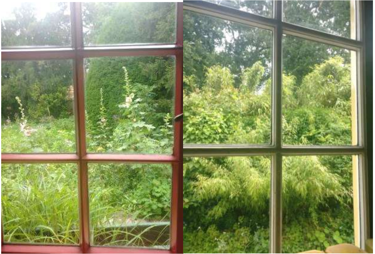
De tuin om het huis gedrapeerd geeft Uit elke raam een ander uitzicht.